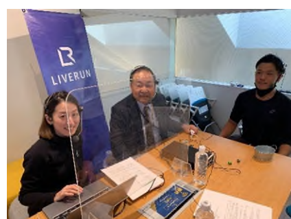
【LIVE RUN 実況中継の様子】