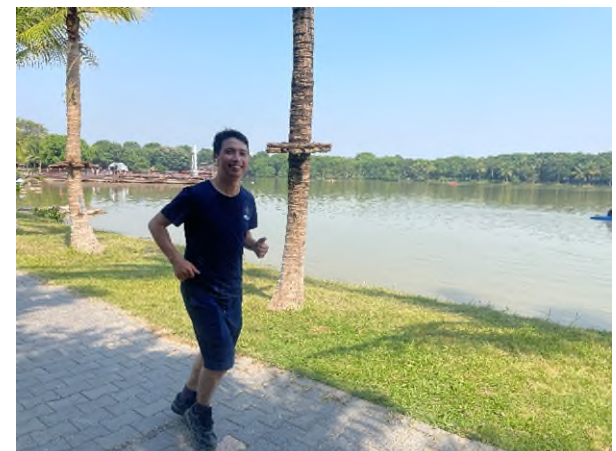
【LIVE RUN 当日参加者の様子】